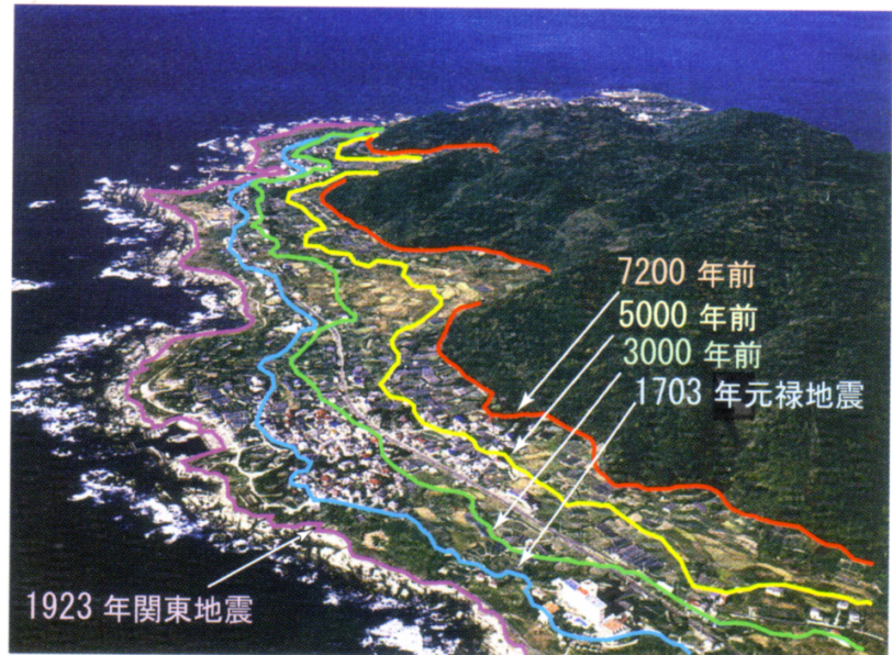
図1 房総半島に見られる海岸段丘. 段丘は4段に区分でき, それぞれ大規模な地震によって生成されたと考えられる.