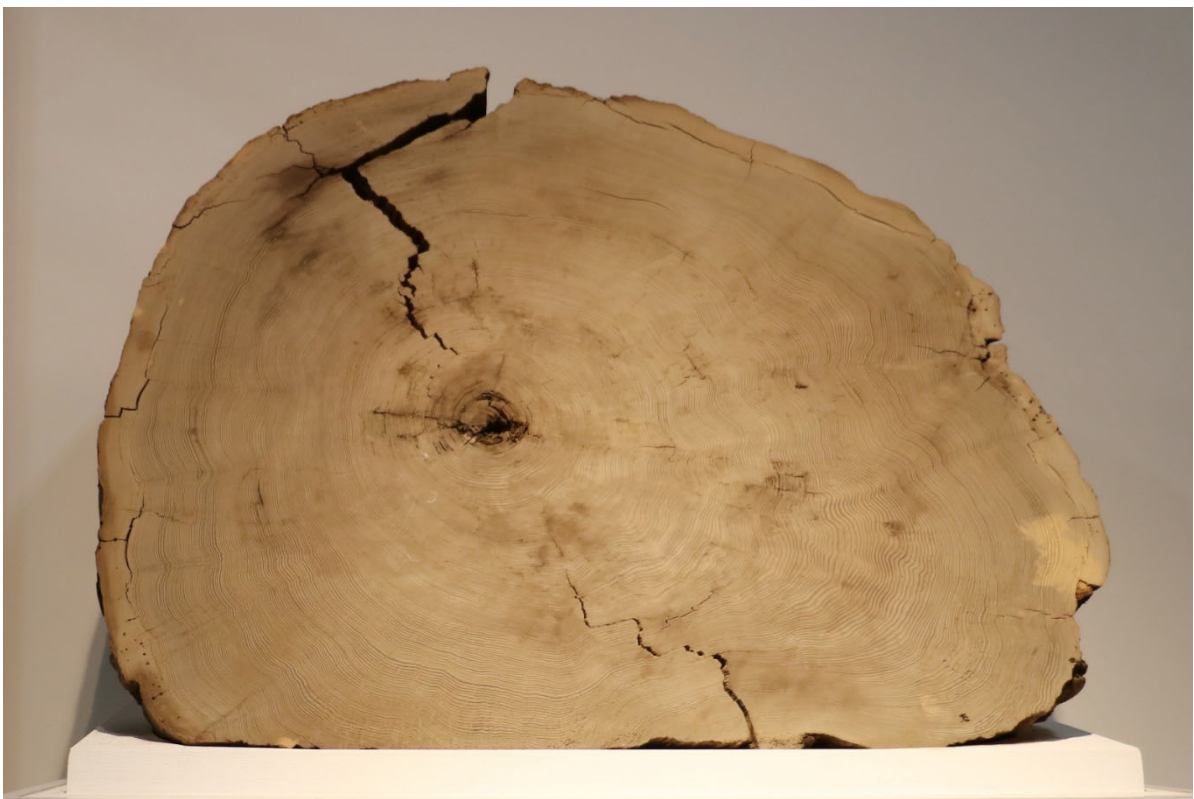
図 1：分析に用いたものと同じ個体の鳥海神代杉（山形大学附属博物館所蔵）。紀元前 466 年に噴火した鳥海山の山体崩壊により埋没した個体を入手した。1 年輪の幅は典型的に 3-5mm と比較的厚く、早材・晩材の剥離が可能となった。

宇宙線生成核種の測定分析から見つけている西暦 775 年、西暦 994 年、紀元前 660 年頃の 3 つの太陽面爆発が仮に現在発生すると、人工衛星の故障や通信障害など、現代社会へ甚大な被害が及ぶと考えられています。今回の研究は、そのような太陽面爆発が数年にわたって立て続けに発生した可能性を示すものです。今後、南極氷床コアのベリリウム 10 分析などから、紀元前 660 年頃のイベントについて、さらに詳しい情報がもたらされることが期待されます。