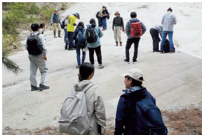
白岩の地層の観察に取り組む地質調査法実習の履修生

理工学部後援会からのご援助で今年度も大過なく実習を終えることができました。予算規模の関係で次年度以降のご支援は難しいとのことですので、最後になりますがこれまでの感謝を述べさせていただきます。ありがとうございました。