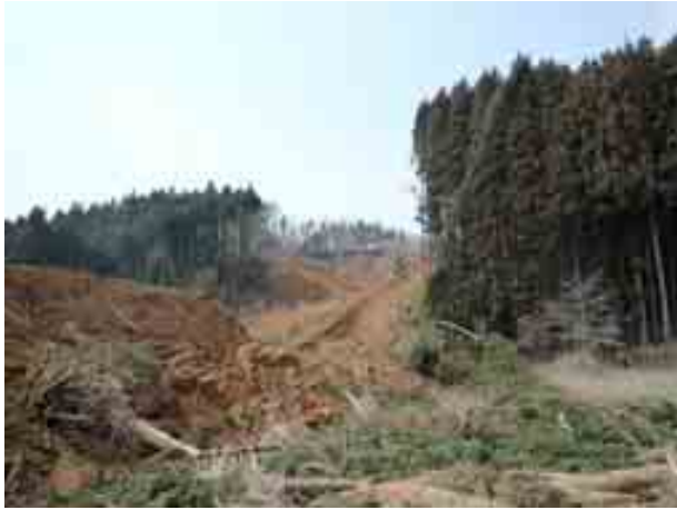
写真-3 葉の木平-斜面崩壊全景③