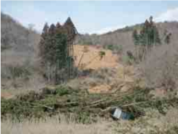
写真-13 白河市-294号線沿い(北の入周辺)の 斜面崩壊①