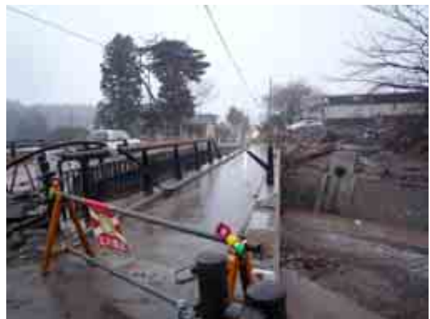
写真 藤沼貯水池-本堤下の