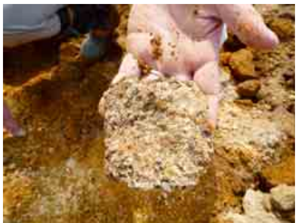
写真-6 白河石 (③)