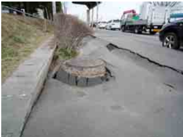
写真-8 南湖南の国道 289 号線沿いの歩道の下水管路部の沈下①