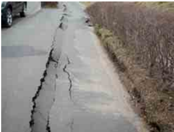
写真-10 南湖南の国道 289 号線沿いの歩道の噴砂跡①