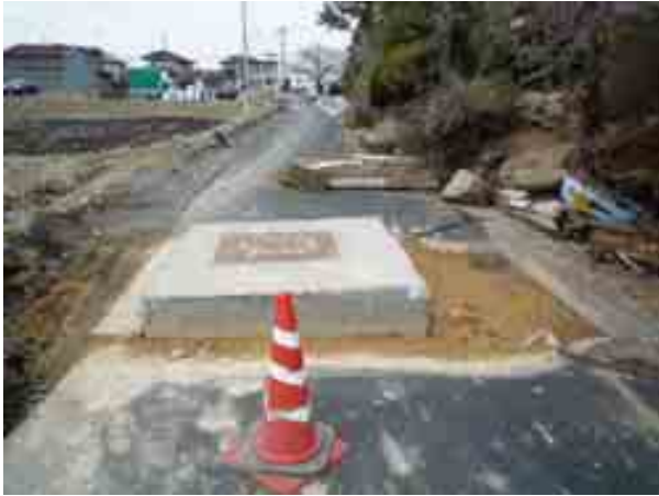
写真-12 南湖南の国道 294 号線沿いの新興住宅地における下水施設の浮き上がり②