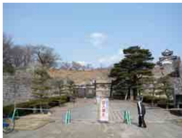
写真-2 小峰城の石垣崩落②