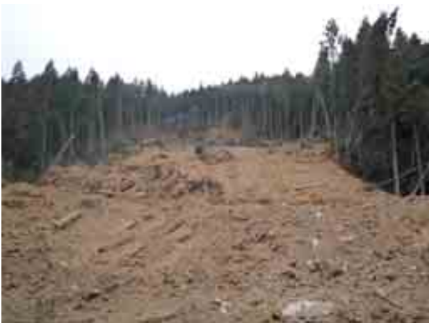
写真-13 白河市-県道58号線沿い(岡の内)の 斜面崩壊③