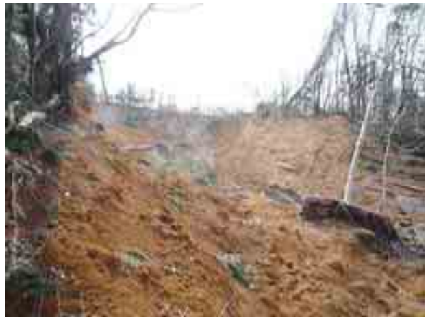
写真-14 白河市-294号線沿い(牛清水周辺) の斜面崩壊②