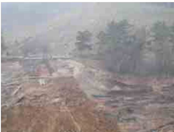
写真 藤沼貯水池-本堤の崩壊