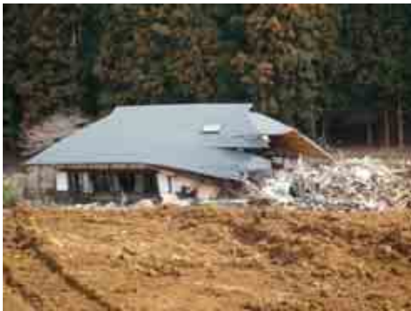
写真-5 葉の木平-崩壊土により 一部破損した住宅③