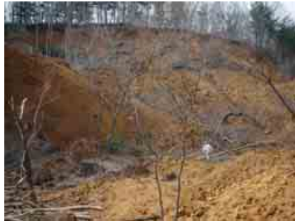
写真-4 葉の木平-斜面崩壊上部③