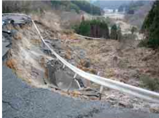
写真-14 白河市-県道58号線沿い(岡の内周辺) の周辺斜面崩壊