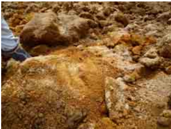
写真-7 風化した白河石