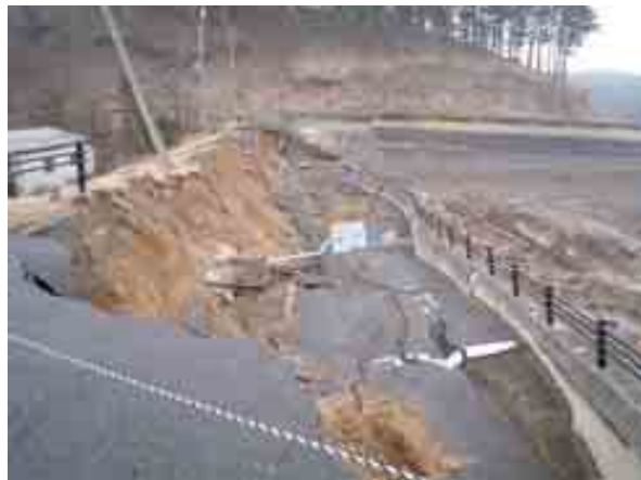
写真 藤沼貯水池-副堤の堤内側のすべり破壊