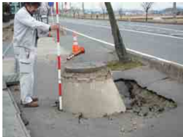
写真-9 南湖南の国道 289 号線沿いの歩道のマンホール浮き上がり①