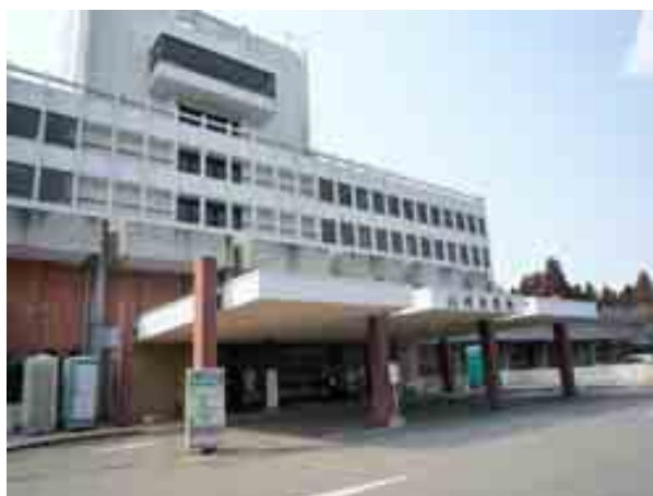
写真-1 白河市役所全景①