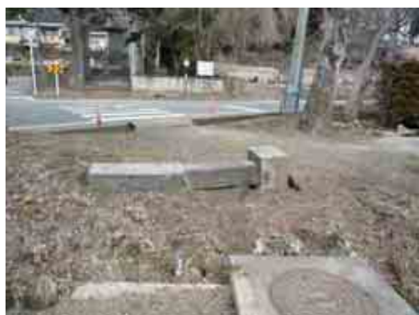
写真-11 南湖南の国道 294 号線沿いの新興住宅地における石柱の転倒②