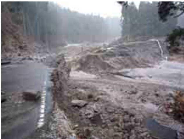
写真 藤沼貯水池-本堤下のボックスカルバート とその上の道路盛土の崩壊