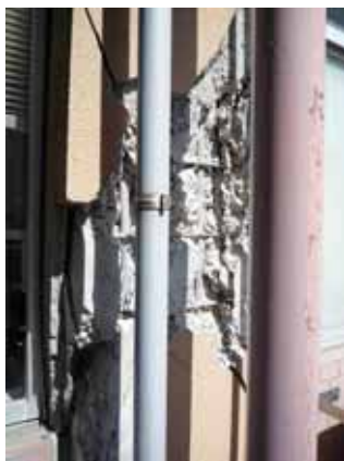
写真-2(2)② 福島県北分庁舎(郡山市) 1F 柱のせん断破壊(主筋は丸鋼)