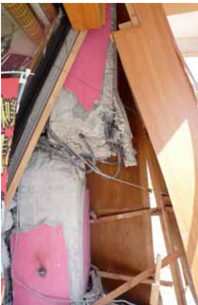
写真-4(2)④ 回転ずし店舗の崩壊 (RC柱のせん断破壊)