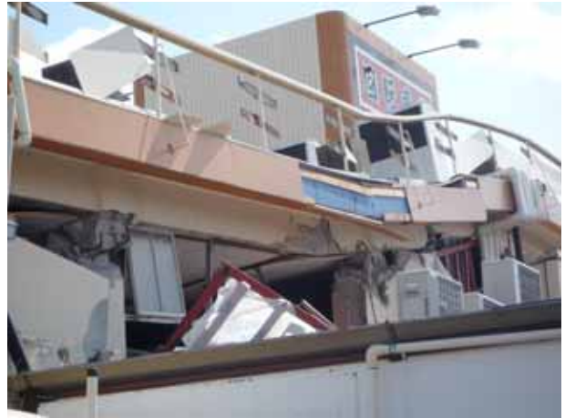
写真-4(1)④ 回転ずし店舗の崩壊 (RC柱のせん断破壊)