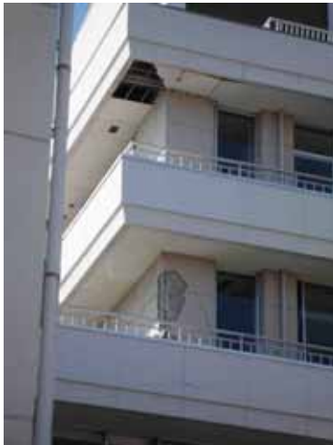
写真-7⑦郡山市中央公民館 (RC柱のせん断破壊)