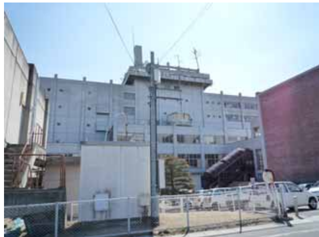
写真-5⑤ 市役所のペントハウスの2,3階の崩壊 中間の水槽タンクの崩壊(気象庁震度計とあわせて)