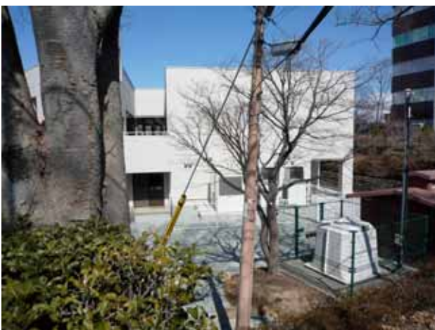
写真-6⑥ 開成公園内のk-net 郡山(市役所前)