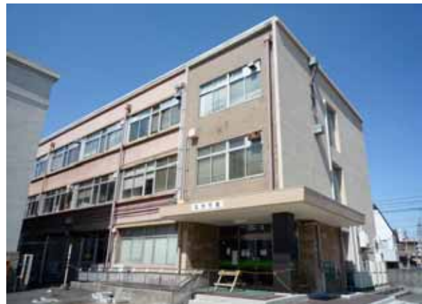
写真-2(1)② 福島県北分庁舎(郡山市)全景