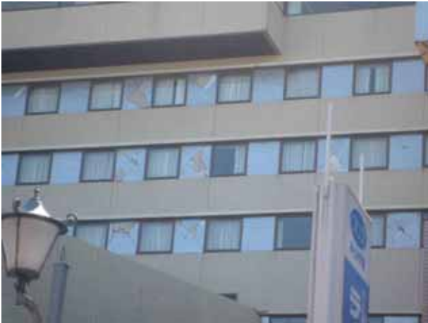
写真-3③ホテルはまつの客室壁のせん断破壊