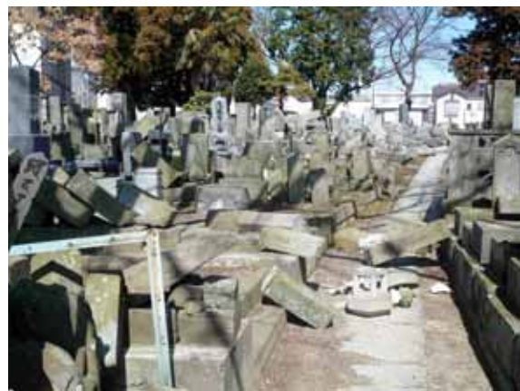
写真-2(3)② 福島県北分庁舎(郡山市)周辺の 如實寺の墓石(9割程度転落)