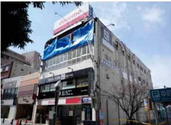
写真-1① 百貨店うすい前の建物 全面の壁の崩落